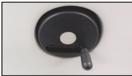
Rueda para el ajuste del tope lateral del alimentador, de la perforación y de la recepción