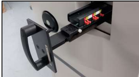
Cambio de peine simple en menos de 2 minutos