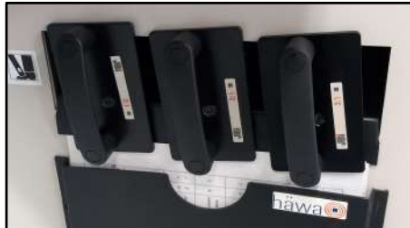
Espacio de almacenamiento para 3 peines