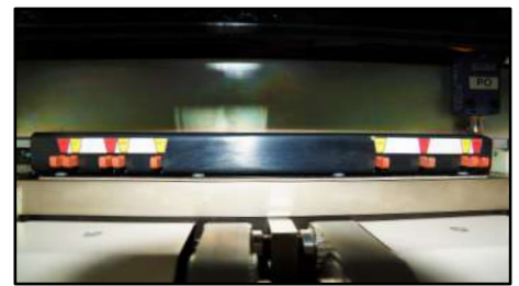
Amplia gama de peines de perforación de calidad con punzones retráctiles