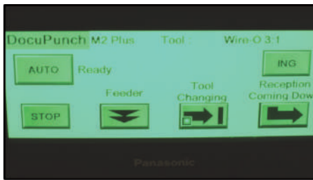
Pantalla de control táctil