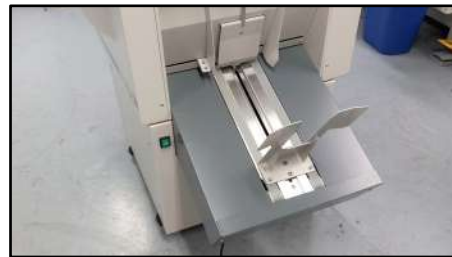
Recepción con capacidad de 250 mm (5 resmas)