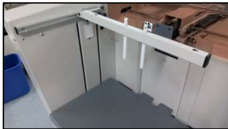
Alimentador con capacidad de 250 mm (5 resmas)