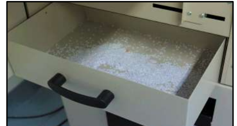
Caja de confeti de gran capacidad